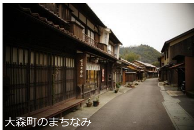
大森町のまちなみ